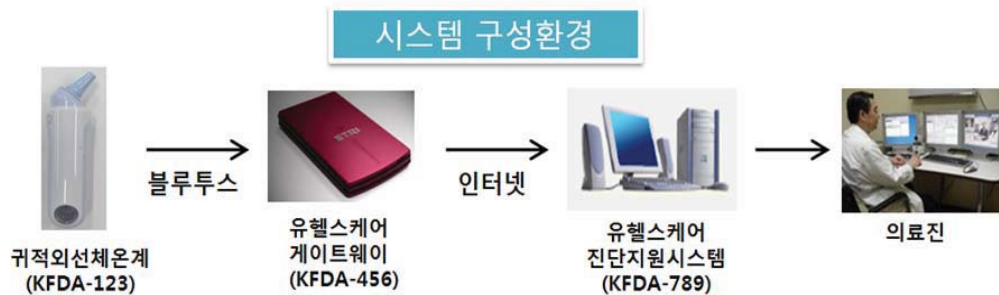
그림 6. 시스템 구성환경 작성의 예