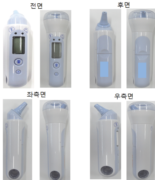
그림 3. 외관사진 작성의 예