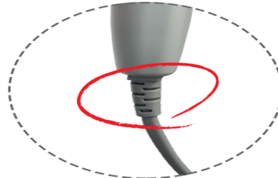
자사 적외선 조사기