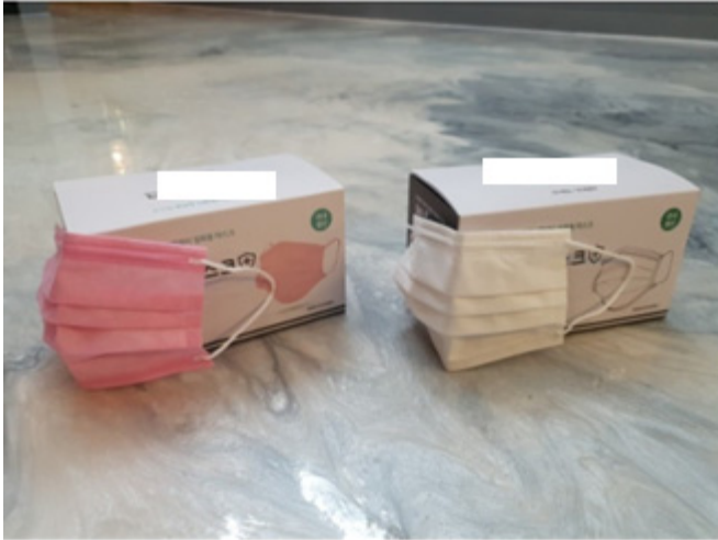
[식약처허가]국산 KF-AD 마스크 50매 비말차단 MB 필터 의약외품 덴탈 일회용