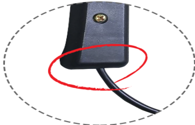
타사 적외선 조사기